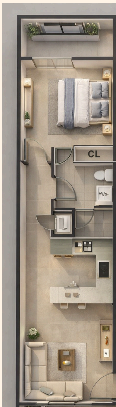
REY UNIDAD 101: