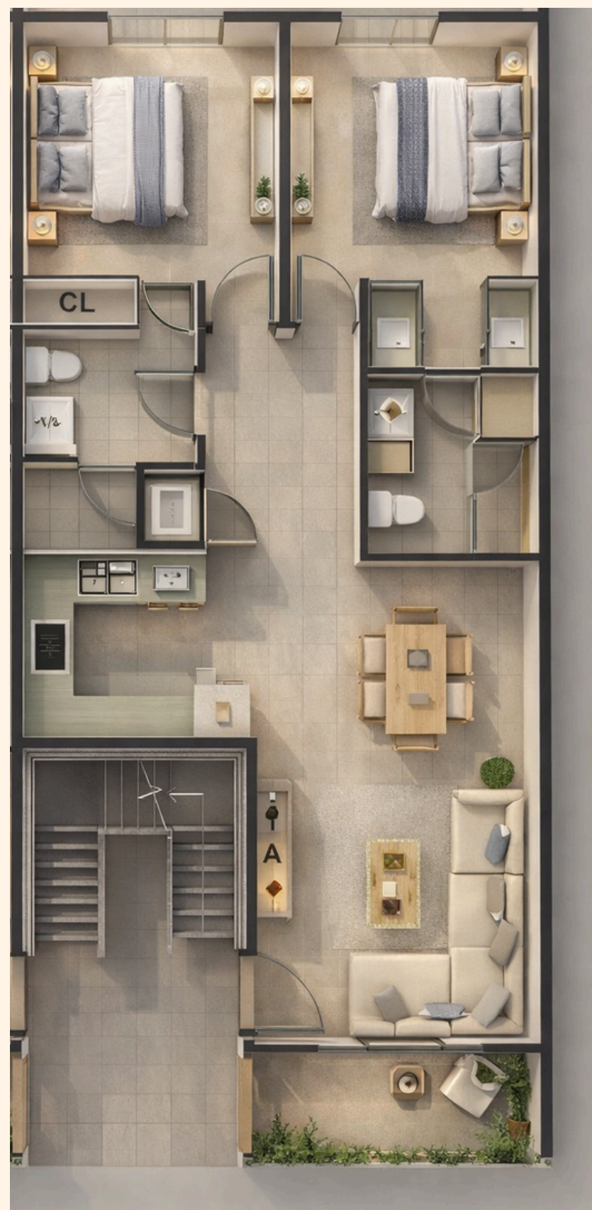
REINA UNIDAD 202: