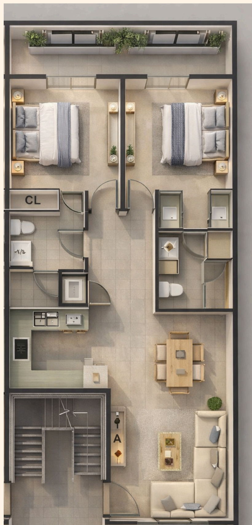
REINA UNIDAD 201: